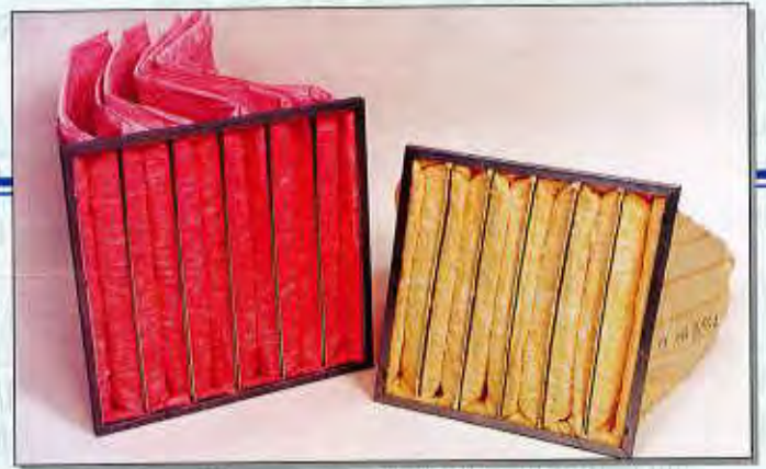
Filtre à poche efficacité 30% à 95%