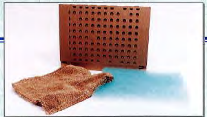
Filtre à peinture