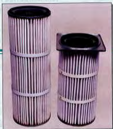
Cartouche à élément plissé en feutre polyester

Cartridge - polyester felt pleated elements