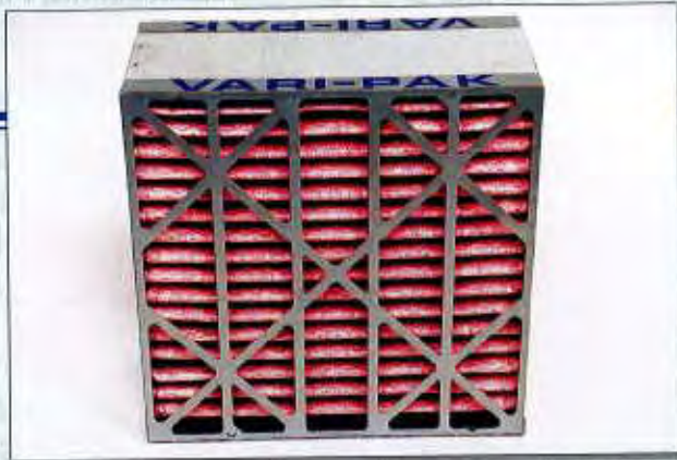
Filtre Vari-Pak de 65% à 99,97%