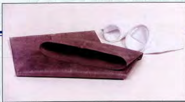
Sac filtrant à eau