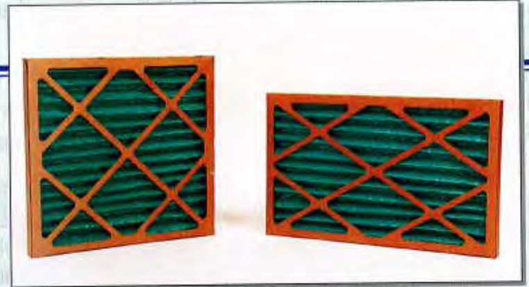
Filtre à élément plissé épaisseur 1"-2"-4"-5"

Pleated element filter 1"-2"-4"-5" of thickness