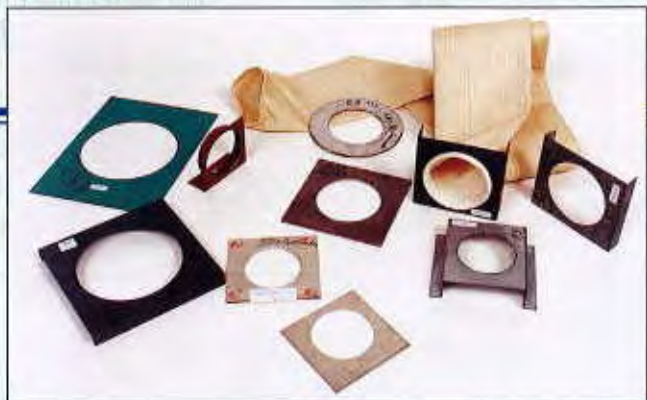
Plaques à trou pour échantillon