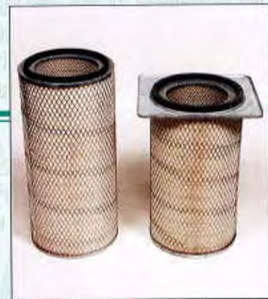
Cartouche à élément plissé en cellulose

Cartridge - pleated elements made of washable polyester SPUN BOND