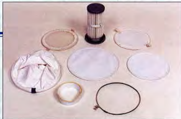
APPLICATION Filtre à plastique