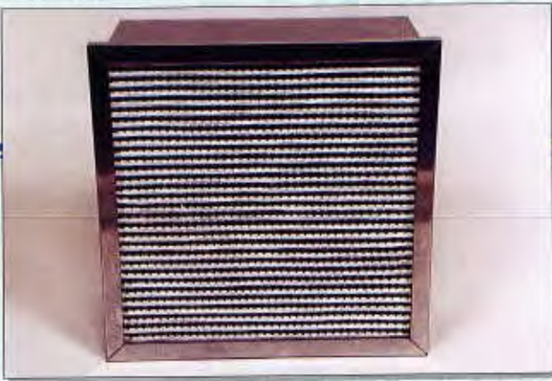
Filtre à efficacité 99,97%