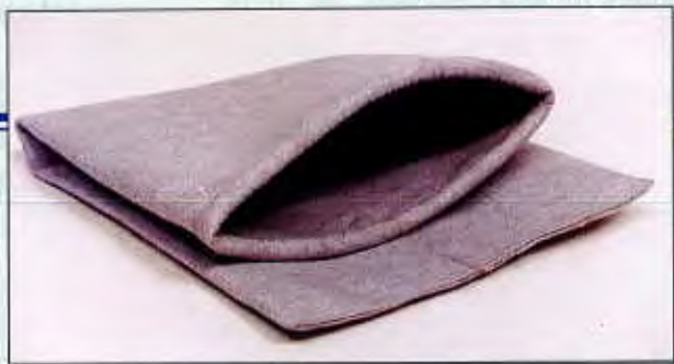
Filtere antistatique pour reliure en papier